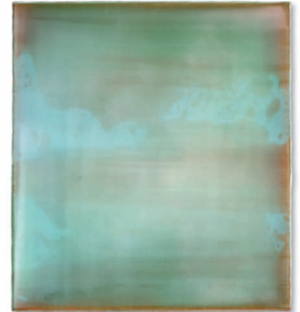
20220228 – 2022 Acryl auf Leinwand / acrylic on canvas – Format 50 x 45 cm

Monochrom wirken die hochglänzenden Bilder von Jus Juchtmans nur auf den ersten Blick: Die mit dem Rakel auf die Leinwand aufgetragenen zahlreichen Farbschichten lassen sich an den Rändern seiner Arbeiten einzeln ablesen. Durch ihre Transparenz öffnet sich ein Bildraum, der durch die Reflektion des Lichts noch verstärkt wird. Das wache Gespür für das Interessante, das aus der Reduktion, dem „Sein lassen“ entstehen kann, führte zu jenen Bildern, die im Frühjahr 2022 erstmals in München gezeigt werden. Hier erkannte Jus Juchtmans, dass die Auflösung der Materialität und das „absolute Bild“ manchmal bereits nach einigen wenigen Schichten gelungen war. Das Ergebnis sind auch hier scheinbar atmende Bilder, von denen man nicht weiß, ob sie erscheinen oder verschwinden. Sie reagieren durch ihre hochglänzende Oberfläche unmittelbar auf ihre Umgebung, reflektieren sie in sich selbst und machen sie damit zum „flüchtigen Teil des Bildgeschehens“, wie es Michael Fehr einmal ausdrückte. Mit seinen oszillierenden Werkschöpfungen gehört Jus Juchtmans zu den bekanntesten Positionen Europas im Bereich der monochromen Malerei.