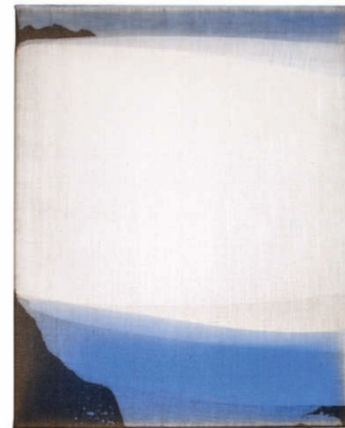
20181123 – 2018 Acryl auf Leinwand / acrylic on canvas – Format 50 x 40 cm