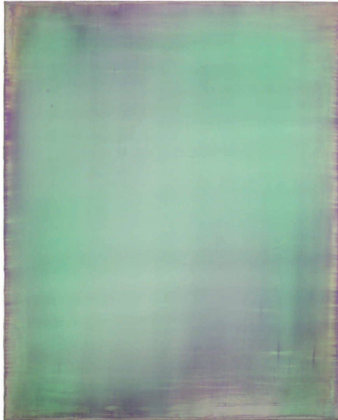
20211121 – 2021 Acryl auf Leinwand / acrylic on canvas – Format 100 x 80 cm