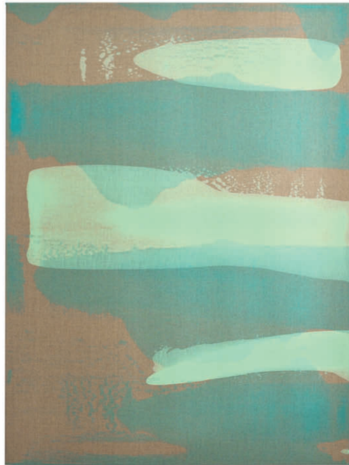
20190126 – 2019 Acryl auf Leinwand / acrylic on canvas – Format 120 x 90 cm

Vernissage: Freitag, 13. Mai 2022 – 18 bis 20 Uhr Matinee: Samstag, 14. Mai 2022 – 12 bis 16 Uhr